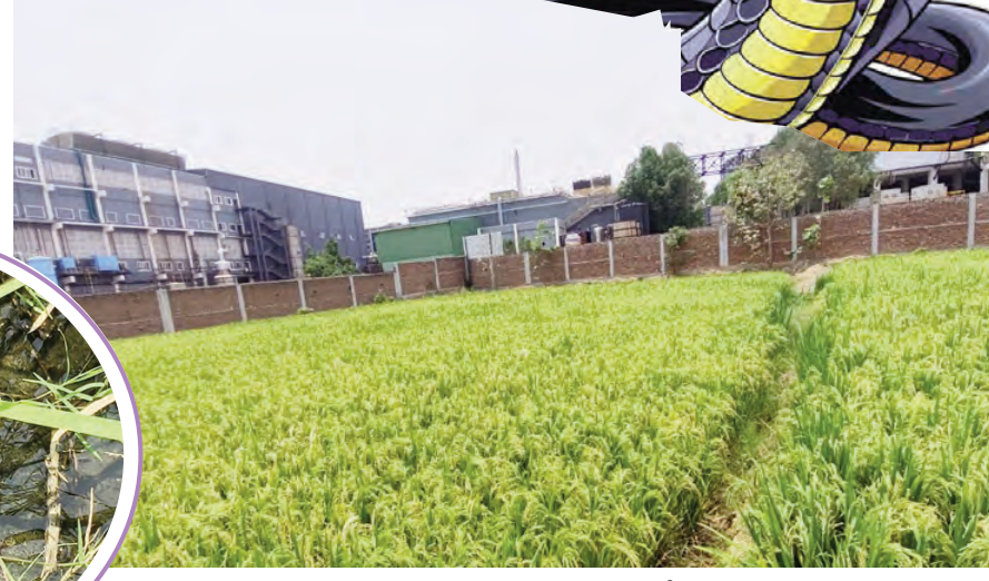
పంట పొలాలు దగ్గరగా కంపెనీ

ఉండడాపూర్వం డ్యామ్ లో పోయిందని ప్రస్తుతం ఈ భూమిని నమ్ముకుని తాము జీవనం కొనసాగిస్తున్నామని ఇప్పుడు కంపెనీ యజమాన్యం కన్ను తమ భూమిపై పడిందని వారు ఆవేదన వ్యక్తం చేశారు. తమ ప్రాణాలు పోయినా సరే ఆ భూమిని కంపెనీకి ఇచ్చేది లేదని కంపెనీ ద్వారా విడుదలవుతున్న వాయు, జల కాలుష్య నివారణకు సంబంధిత అధికారులు చర్యలు చేపట్టాలని లేనివ్వకంలే తాము ఊలు వ్యవసాయ పనులు చేయలేక జీవనం పోరాటం చేయాల్సిన దుర్భర పరిస్థితి ఏర్పడిందని ఇప్పటికైనా అధికారులు చర్యలు చేపట్టాలని గిరిజన రైతులు తండావాసులు ఆవేదన వ్యక్తం చేశారు.