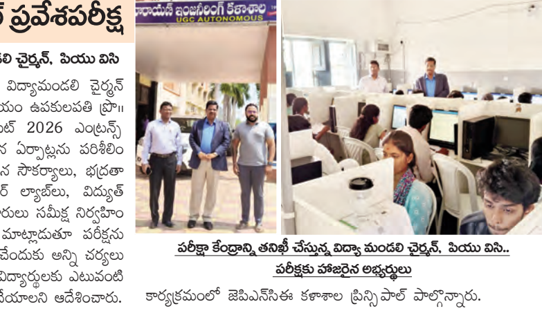
పరిక్షా కేంద్రాల తనిఖీ చేస్తున్న విద్యా మంత్రి చైర్మన్, పియు విసి.