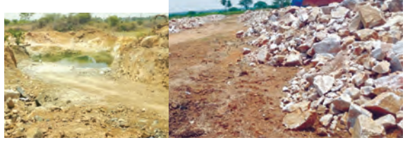
డిండి శివారులో డంపింగ్ చేసిన మెటీరియల్

అనుమతులు లేకుండా అక్రమ బ్యాన్సింగ్ అయ్యవారి పట్ల శివారులో జోరుగా సాగుతున్న అక్రమ మైనింగ్