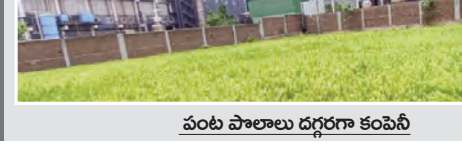
పంట పాతాలు దగ్గరగా కంపెనీ