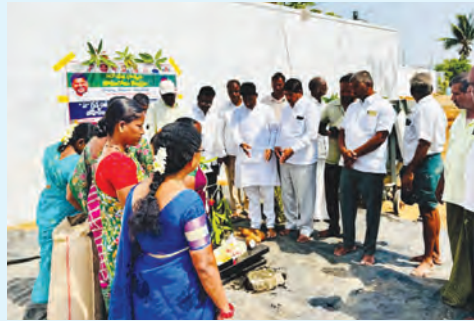
ఉప్పలిపల్లిలో వరి ధాన్యం కొనుగోలు కేంద్రం ప్రారంభమున అధికారులు, నాయకులు

ఉప్పునంతల, మే 10 ప్రభాతవార్త : మండలంలోని ఉప్పలిపల్లి గ్రామంలో ఆదివారం ఐకెసి, గ్రామ మహిళా సంఘాల్లో ఆధ్వర్యంలో వరి ధాన్యం కొనుగోలు కేంద్రాన్ని ప్రారంభించారు.