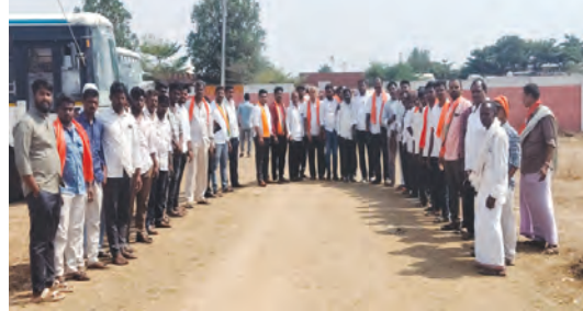
ప్రధాని మోదీ సభకు బయలుదేరిన బిజిపీ నాయకులు