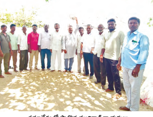
సమావేశంలో పాల్గొన్న ముదిరాజ్ నాయకులు