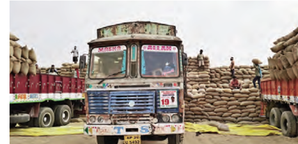
కొనుగోలు కేంద్రం వద్ద లాభాలలో లోటీ చేస్తున్న వడ్డకర్లు

అని రైతులను బెదిలిస్తున్న లాభాల కాంట్రాక్టర్ నర్స, మే 10 ప్రభాతవార్త: ఆరుగంట కష్టంపటి పంటలను రైతులకు పరిస్థితి దయనీయంగా మారినది. అమ్మ బోతే అడవి... కొనబోతే కొరివి అన్న చందంగా ఎన్నో ఒడిదుడుకులను ఎదురీడి పండించిన పంటను అమ్ముకుందామంటే పరిస్థితులు సహజంగా ఉంటున్నాయి. ఒక కిలో ఎక్కువ తూకం వేస్తేనే కొనుగోలు సేవేమీ అందుతున్న మిల్లర్లు. అదనంగా గాడబ్బులు చెల్లిస్తేనే లాభం దొందని, వరతులు విధిస్తుంటుంటే రైతులపరిస్థితి అడవికంటే పోకెక్కలా తయారైంది. అలాంటి పరిస్థితులలో అసలు ధాన్యాన్ని ప్రభుత్వానికి విక్రయించాలా...? లేదా ప్రైవేటు మార్కెట్ ను ఆశ్రయించి బేటికి అందించి పుచ్చుకోవాలా...? అన్న మీమాంసలో రైతులు ఆవేదన చెందుతున్నారు. రైతులు పండించిన పంటను హార్వెస్టులో కొనుగోలు చేయడం ద్వారా ఇబ్బందులు లేకుండా చేస్తామని ప్రభుత్వం చెబుతున్నా అని ఆదరణలో మాత్రం చేసి మాపకోవడంతో అన్నదాతలు ఆందోళన చెందుతున్నారు. రైస్ మిల్లర్లు, కొనుగోలు కేంద్రాల నిర్వాహకులు, లాభ యజమానులు ఇన్ఫ్రాస్ట్రాక్చర్ వ్యవహారిస్తున్నా అడిగినా కరువయ్యారు. ప్రభుత్వం సన్న రకం వడ్డ దొడ్డు రకం వడ్డకు ఎక్కువగా ముగ్గు చూపడం లేదు. శనివారం, అదివారం రోజు మరలకే లోని వెంకట సాయి వద్ద ఉండే రైస్ మిల్ కు సన్న రకం