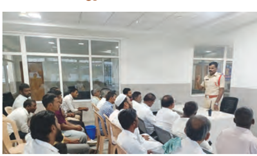
వీని కమిటీ సమావేశంలో మాట్లాడుతున్న ఎమ్మెల్యే రెడ్డి

నారాయణపేట, మే 10 ప్రభాతవార్త : నారాయణపేట రూరల్ పరిధిలో రానున్న బుద్ధి పండుగ సందర్భంగా హిందూ, ముస్లిం మత పెద్దలతో వీని కమిటీ సమావేశాన్ని ఎమ్మెల్యే రెడ్డి నిర్వహించారు. పండుగల సమయంలో శాంతిభద్రతల పరిరక్షణ, మత సామరస్యం, ఆక్రమ కార్యకారాల నియంత్రణపై సమావేశం చర్చించారు. ఈ సందర్భంగా ఎమ్మెల్యే రెడ్డి మాట్లాడుతూ పండుగలను ప్రశాంత వాతావరణంలో నిర్వహించుకోవాలని నూచించారు. మత సామరస్యాన్ని దెబ్బతీసే విధంగా ఎవరూ ప్రవర్తించరాదని, పరస్పర గౌరవ భావంతో వ్యవహరించాలని కోరారు. బుద్ధి పండుగ సేవభ్యం పశువుల ఆక్రమ రవాణా నివారణకు ఉజ్వలి బోర్డర్ చెక్పోస్ట్ ఏర్పాటు చేసి ప్రతి వాహనాన్ని క్షుణ్ణంగా తనిఖీ చేస్తున్నట్లు తెలిపారు. సోఫర్ మీడియాలో వచ్చే పుకార్లు, అసత్య ప్రచారాలను సమస్యపడిన ప్రజలకు నూచించారు. శాంతిభద్రతలకు విఘాతం కలిగించే చర్యలకు పాల్పడితే చట్టసరైన కఠిన చర్యలు తీసుకుంటామని హెచ్చరించారు.