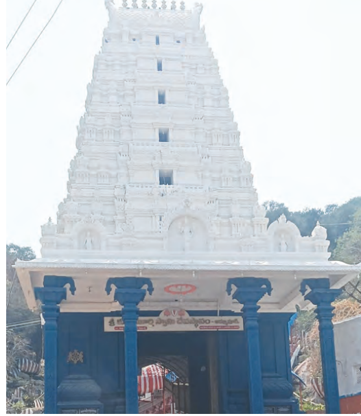
శ్రీ కురుమూర్తి దేవస్థానం