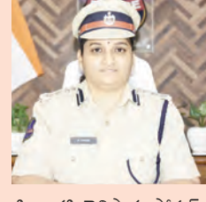
మహబూబ్ నగర్ క్రైమ్, మే 10 ప్రభాత వార్త

: జిల్లాలో వర్షాల మధ్య అపోహలు లేదా ఉద్రిక్తతలు కలిగించేలా సోషల్ మీడియా వేదికల ద్వారా అనుచిత వ్యాఖ్యలు చేయడం, అసత్య ప్రచారాలు, ఫేక్ న్యూస్ పేర్ చేయడం చట్టపరంగా చర్యలకు గురయ్యే అంశాలుగా పరిగణించ బడతాయని జిల్లా ఎస్.డి. జానకి తెలిపారు. సోషల్ మీడియా ప్లాట్ఫామ్స్ లను బాధ్యతాయుతంగా వినియోగించుకోవాలని, నిర్ధారించిన సమాచారాన్ని ఫార్వర్డ్ చేయకుండా జాగ్రత్త వహించాలని సూచించారు. సమాజంలో అపోహలు లేదా ఉద్రిక్తతలకు దారితీసే పోస్టులు, వీడియోలు, కామెంట్లు చేయడం మంచి కాదని పేర్కొన్నారు. ఈ నేపథ్యంలో జిల్లా పోలీస్ కార్యాలయంలో సోషల్ మీడియా పర్యవేక్షణ కొనసాగుతోందని, చట్టాన్ని ఉల్లంఘించేవిధంగా వ్యవహరించిన వారిపై అవసరమైన చట్టపరమైన చర్యలు తీసుకోబడతాయని తెలిపారు. జిల్లాలో శాంతి భద్రతలు కాపాడడం ప్రతిపాదించి భాద్యత అని, సామాజిక బద్ధతను పరిరక్షించేందుకు అందరూ సహకరించాలని జిల్లా ఎస్.డి. జానకి అసత్య ప్రచారం లేదా అనుచిత పోస్టులు గమనించినట్లయితే జిల్లా పోలీసు కంట్రోల్ రూమ్ నంబర్ 8712659360 కు సమాచారం ఇవ్వగలరు. ఆందించిన సమాచారం గోప్యంగా ఉంచబడుతుంది.