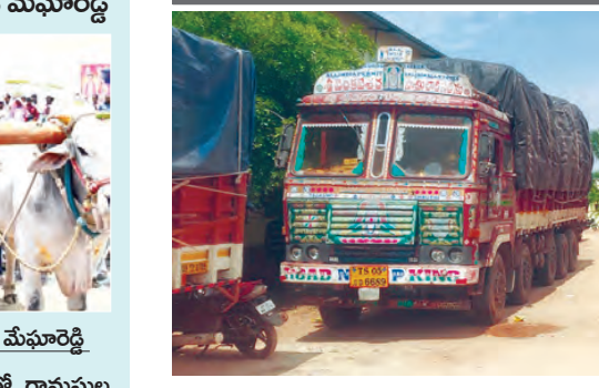
ఉప్పునుంతుల గోదాం వద్ద మక్కలు నింపుకుని వచ్చి గోదాం వద్ద నిలిచిన లారీలు, డీసీఎంలు

ఉప్పునుంతుల, మే10 ప్రభాతవార్త: యాసంగిలో రైతులు సాగు చేసుకున్న మొక్కజొన్న కొనుగోలు చేసే లారీలతో నింపుకొని వచ్చి గోదాం చుట్టూ నిలిచిపోయాం. యూ.హార్వీ ఫెడ్ అధికారుల నిర్లక్ష్యంతో లారీలు, డీసీఎంలు నిలిచి పది రోజుల తర్వాత దింపుకోవడానికి మోక్షం కుదరడం లేదు. ఉప్పునుంతుల మండలంలో మొక్కజొన్న కొనుగోలు కేంద్రాలు ఏర్పాటు చేయటంతో ఇతర ప్రాంతాల వారికి మొక్కజొన్న కొనుగోలు కేంద్రాలు అవకాశం వచ్చింది. ఇతర ప్రాంతాల నుంచి వచ్చిన లారీలు గ్రామంలో ఎక్కడ వడితే అక్కడ నిలిచిపోయాయి. తెలకపల్లి మండలం నుంచి మొక్కజొన్న కొనుగోలు చేసే లారీలు, డీసీఎం లారీలతో మండల కేంద్రమైన ఉప్పునుంతుల పిఎస్ఐ వారి గోదాం లో అన్నోడింగ్ చేయాలింది. కానీ మార్గ్ ఫెడ్ అధికారులు చుట్టూ చూపు లాగా అన్నోడింగ్