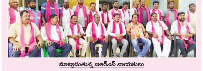
మాట్లాడుతున్న జిఆర్ఎస్ నాయకులు