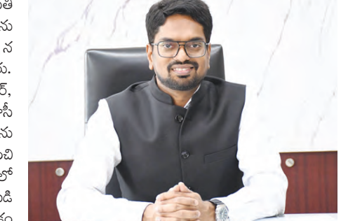
వెబ్ కాన్ఫరెన్స్ లో జిల్లా కలెక్టర్ ఆదర్శ సురభి

వనపర్తి, మే 10, ప్రభాతవార్త: రైతులు పండించిన ప్రతి ధాన్యపు గింజలను ప్రభుత్వం మద్దతు ధరతో కొనుగోలు చేస్తుందని, రైతులు ఎవరూ ఆందోళన పడాల్సిన అవసరం లేదని జిల్లా కలెక్టర్ ఆదర్శ సురభి అన్నారు. అధికారం అదనపు కలెక్టర్ రెవెన్యూ విశ్వం కుమార్, సివిల్ సబ్ అధికారి, వ్యవసాయ, కోపరేటివ్, తహసీల్దార్లు, మిల్లర్లు, ఐటీ సహకార సంఘాల వద్ద కొనుగోలు కేంద్రాల సభ్యులతో వెబ్ కాన్ఫరెన్స్ నిర్వహించి వరి కొనుగోలు ప్రక్రియను సమీక్షించారు. రైస్ మిల్లర్లతో ధాన్యం త్వరగా దింపకొకూడా రోజుల తరబడి లాల్లు అగిపోవడం, కొనుగోలు కేంద్రాల్లో తూకం వేయకపోవడం పై వివరాలు అడిగారు. లాల్లో తిన్న వడ్లు నాణ్యత లేదని, తాలు, చెత్త ఎక్కువగా ఉండడం వల్ల ఎన్ఎస్ఐకి నాణ్యమైన బియ్యం తిరిగి ఇవ్వడం సాధ్యం కాదని, అందుకే రైతులు నిబంధనల ప్రకారం నాణ్యమైన వడ్లు ఇవ్వాలి అంటూ కోరుతున్నట్లు మిల్లర్లు కలెక్టర్ దృష్టికి తెచ్చారు. స్పందించిన కలెక్టర్ రైతులు ప్రైవేట్ సహకారం తీసుకోవడం వల్ల వడ్లు కొనుగోలు కేంద్రానికి తీసుకురావాలని నాణ్యమైన వడ్లు వేలాంటి ఇబ్బందులు లేకుండా వెంటనే కొనుగోలు చేసి డబ్బులు ఖాతాల్లో జమ చేయడం జరుగుతుందన్నారు. కొనుగోలు చేసిన ధాన్యాన్ని ట్యాంక్ ఎంట్లో చేయడంలో జాప్యం లేకుండా చూడాలని అధికారులను ఆదేశించారు.