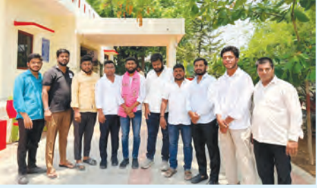
మాట్లాడుతున్న బీఆర్ఎస్ యువజన నాయకులు