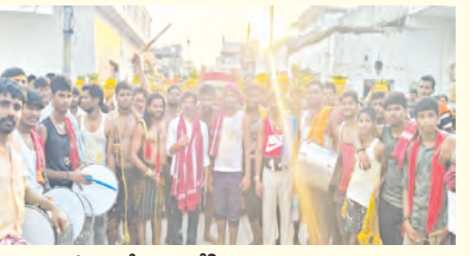
బీరప్ప బోనాల ఊరేగింపు నిర్వహిస్తున్న దృశ్యం