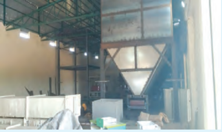
డికార్డ్ గ్రేటర్ లో అడుగుతనమైన యంత్రాల బిగింపు