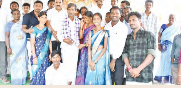
గ్రామస్థులతో మంత్రి జూబిలి కృష్ణారావు, వనపర్తి ఎమ్మెల్యే తూడి మేఘారత్న

◆ మంత్రి జూబిలి కృష్ణారావు, వనపర్తి ఎమ్మెల్యే తూడి మేఘారత్న