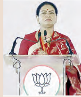
మహబూబ్ నగర్ ఎంపీ డీకే అరుణ

మహబూబ్ నగర్, మే 10, ప్రభాతవార్త: పశ్చిమ బెంగాల్ మాదిరి తెలంగాణలో బిజెపిని అధికారంలోకి తీసుకువచ్చాలని మహబూబ్ నగర్ ఎంపీ డీకే అరుణ పిలుపునిచ్చారు. సికింద్రాబాద్ పరేడ్ గ్రౌండ్స్ లో ప్రధాని మోడీ బహిరంగ సభలో మహబూబ్ నగర్ ఎంపీ డీకే అరుణ ప్రసంగించారు. నీళ్లు, నిధులు నియామకాల నివాదం నేటికే నెరవేరలేదని, బిఆర్ఎస్ కాంగ్రెస్ లో చోటు పుచ్చుకోవాలని ప్రజలను మోసం చేశారని ఆరోపించారు. భవిష్యత్తులో తెలంగాణ ప్రజల కల సాకారం కావాలంటే, అన్ని వర్గాల ప్రజలు అభివృద్ధి చెందాలంటే కలలుగన్న తెలంగాణ సాకారం కావాలంటే అభివృద్ధి జరగాలంటే బిజెపి తోనే సాధ్యం అని పేర్కొన్నారు. వికేంద్రాబాద్ లో ప్రతి రాష్ట్రం అభివృద్ధి చెందాలని ప్రధాని నరేంద్ర మోడీ తెలంగాణలో పదివేల కోట్ల రూపాయల నిధులతో అభివృద్ధి పనులు అక్షరశబ్దం ప్రారంభించాల్సి వచ్చిందని పేర్కొన్నారు. పశ్చిమ బెంగాల్ లాంటి రాష్ట్రం లో కూడా బిజెపిని గెలిపించారంటే నరేంద్ర మోడీ దేశ భవిష్యత్తును -మిన4లో..