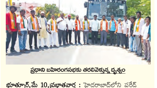
ప్రధాని బహిరంగసభకు తరలివెళ్లిన దృశ్యం