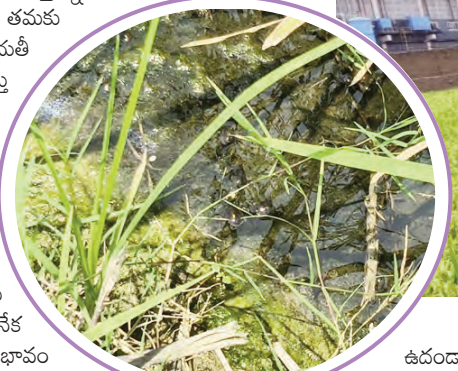
బంజిరీ దిండ్ల నింజులపల్లి కాలుష్యం